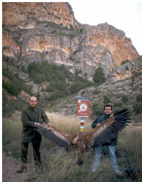
Foto nº2: Exempler trobat mort per electrocució al Barranc del Sint.