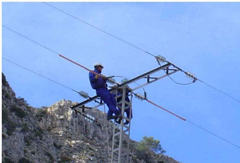
Foto nº4: Correcció del risc d'electrocució mitjançant la col·locació d'aïllaments sobre els ponts, a l'alçada de la creueta de la torre.