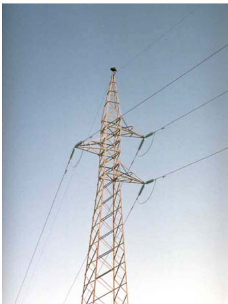
Foto nº1: Exempler posat sobre una torre propera al canyet o A.A.S..