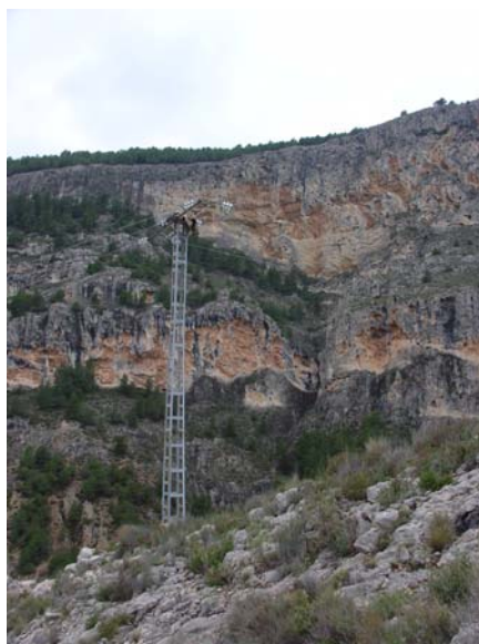
Foto nº3: Voltor mort sobre una de les torres de la línia del Barranc del Sint